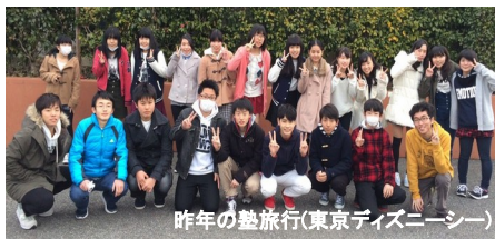
昨年の塾旅行(東京ディズニーシー)