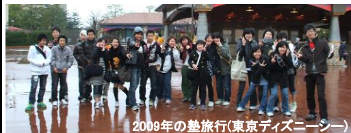
2009年の塾旅行(東京ディズニーシー)